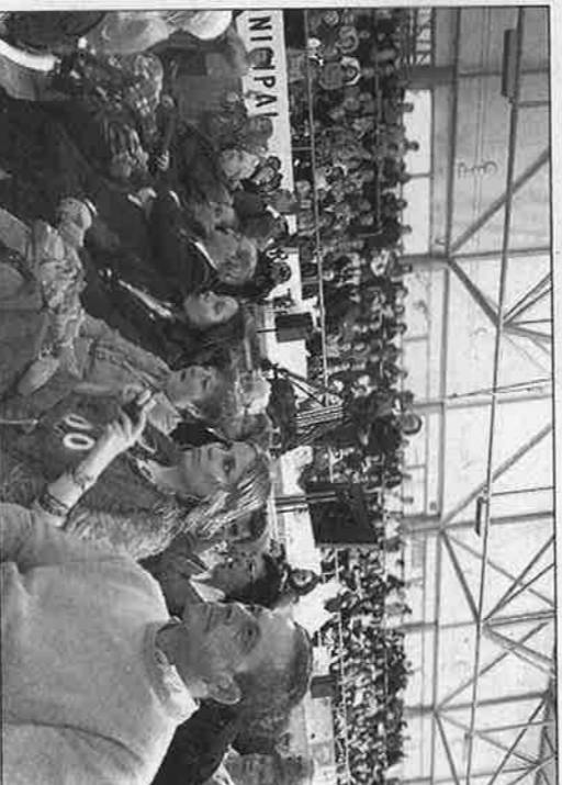
Al público le entusiasmaron las novedades del Pregón de 2010

También se hizo mención en el mismo acto de la entrega del Premio Redoble al dibujante, escritor y académico Antonio Mingote, al que se visitó hace unos días en Madrid para entregarle el galardón. También se pasaron imágenes de este acto.