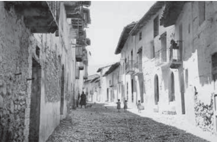
Arxiu de fotografia antiga de la comarca del Matarranya/Matarranya